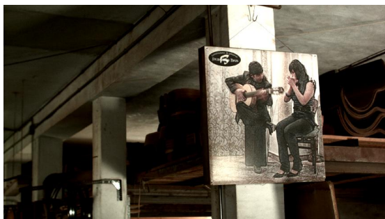
Cartel de la familia Bros